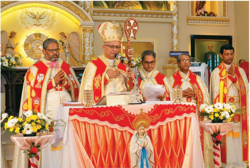
ദൈവാസൻ ആന്റണി തച്ചുപറമ്പിലച്ചന്റെ തുശൂർ അതിരൂപത നാമകരണ കോടതി നടപടികൾ സമാപനം (2020 ഡിസംബർ 8 : ചേലക്കര)