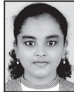
Irene Biju Catheedral