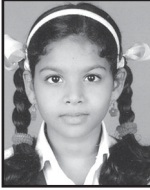
Anugraha Denny Sacred Heart CLPS, Thrissur