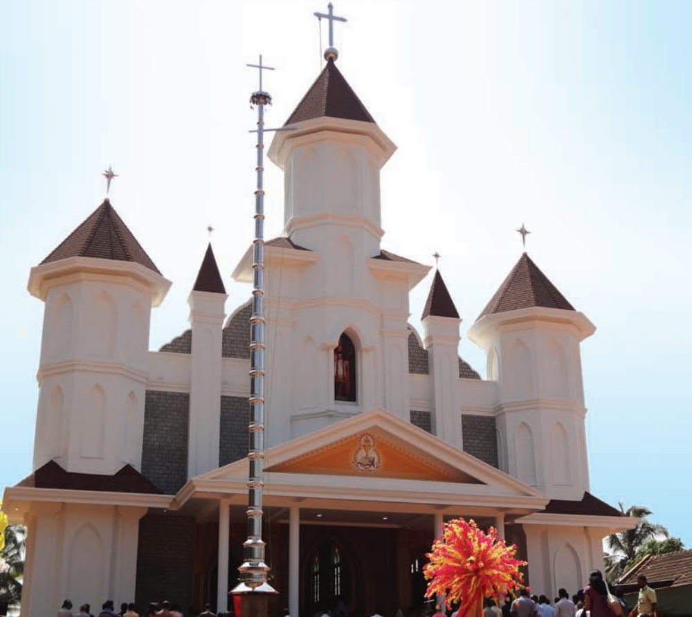
പുതിയതായി കൂദാശ ചെയ്ത വെള്ളാനിക്കോട് സെന്റ് അഗസ്റ്റിൻ പള്ളി ഇൻസെറ്റിൽ അൾത്താര