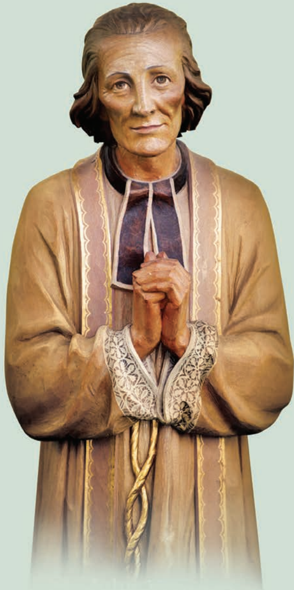
ഇടവക വൈദികരുടെ മദ്ധ്യസ്ഥനായ വി. ജോൺ മരിയ വിയാനി (ആഗസ്റ്റ് 4) ഞങ്ങൾക്കുവേണ്ടി പ്രാർത്ഥിക്കണമേ