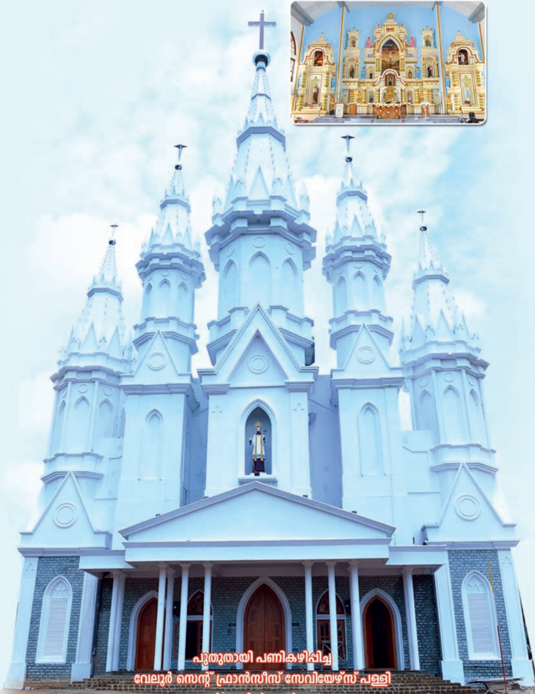
പുതുതായി പണികഴിപ്പിച്ച വേലൂർ സെന്റ് പ്രാൻസിസ് സേവിയേഴ്സ് പള്ളി (ഇൻസെറ്റിൽ അൾത്താര)