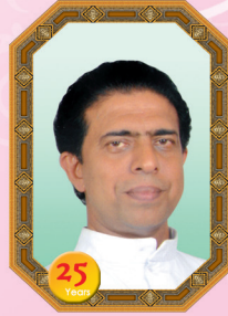
ഫാ. പോൾസൺ പാലത്തിങ്കൽ