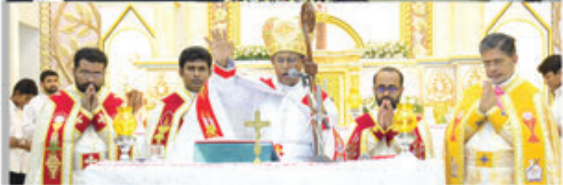
നവീകരിച്ച പുത്തക്കൽ സെന്റ് റോക്കി ചർച്ച് അശർത്താര - 16.05.2019