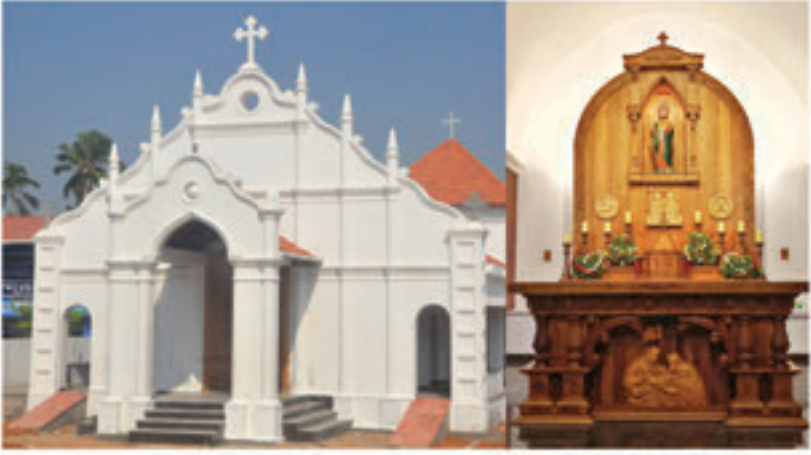
നവീകരിച്ച ആർത്താറ് മാർ തോമ തിർമകേന്ദ്രം - 26.04.2019 (ഹോളിക്രോസ് ചർച്ച് ആർത്താറ്)